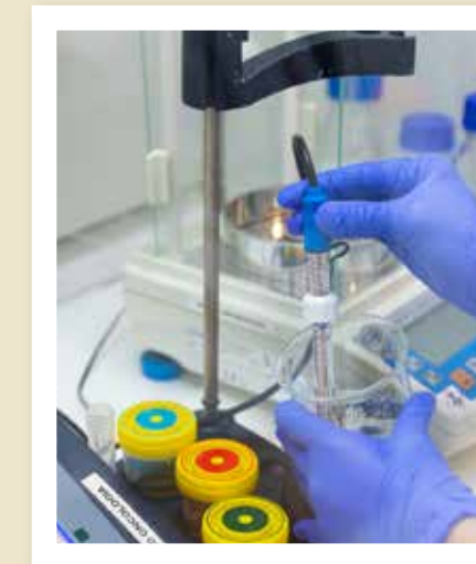
Material de investigación para el Grupo de Tumores y Malformaciones Vasculares